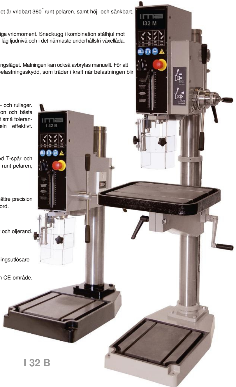
I 32 B

Kylvätskeanordning komplett, maskinbelysning halogen 12V, automatisk reversering, fotreversering, fotströmbrytare start-stopp, verktygs-paket MK3 (maskinskruvstycke 120mm backar, 2x T-spårsmuttrar, chuck 1-13mm B16, dorn MK3, reducerings-hylsor), koordinatbord (inkl. centrum för montering bordarm).