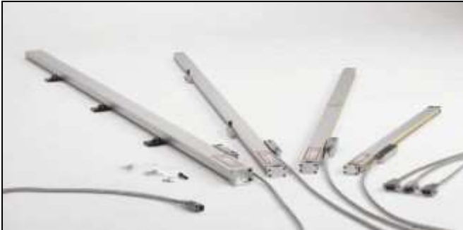
fra venstre mod højre: GS 20, GS 50, GS 10, GS 30;