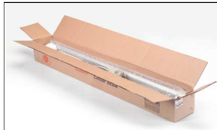
Emballage til op til 1'500 mm vandring.