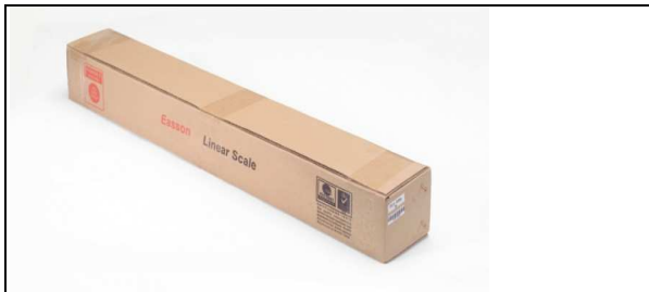
Emballage til op til 1'500 mm vandring.

Alle kasser inkluderer: Skale, Aluminium Base (når det er påkrævet), aluminium dæksler, Beslag, skruer.