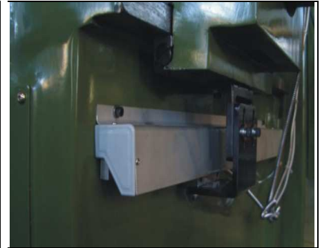
Eksempel på GS Scale installation