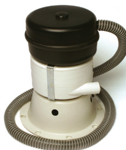
SA 12072 EA Vakuum/filter system