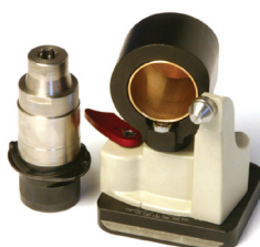
LEX 300 Tilbehør til slibning af bor med 90° spids.