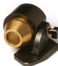
Lex 200 Tilbehør til slibning af pladebor, tilbehørs adaptor nødvendig (LEX 100)