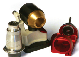
LEX 050 Tilbehør til slibning af store bor 21 – 30 mm