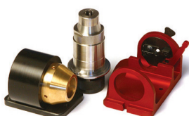
LEX 250 Tilbehør til slibning af trinbor. tilbehørs adaptor nødvendig (LEX 100)