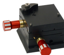
LEX 100 Tilbehørs adaptor